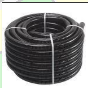
tubi, canaline ed altri manufatti in plastica