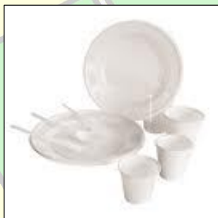
piatti, posate e bicchieri in plastica